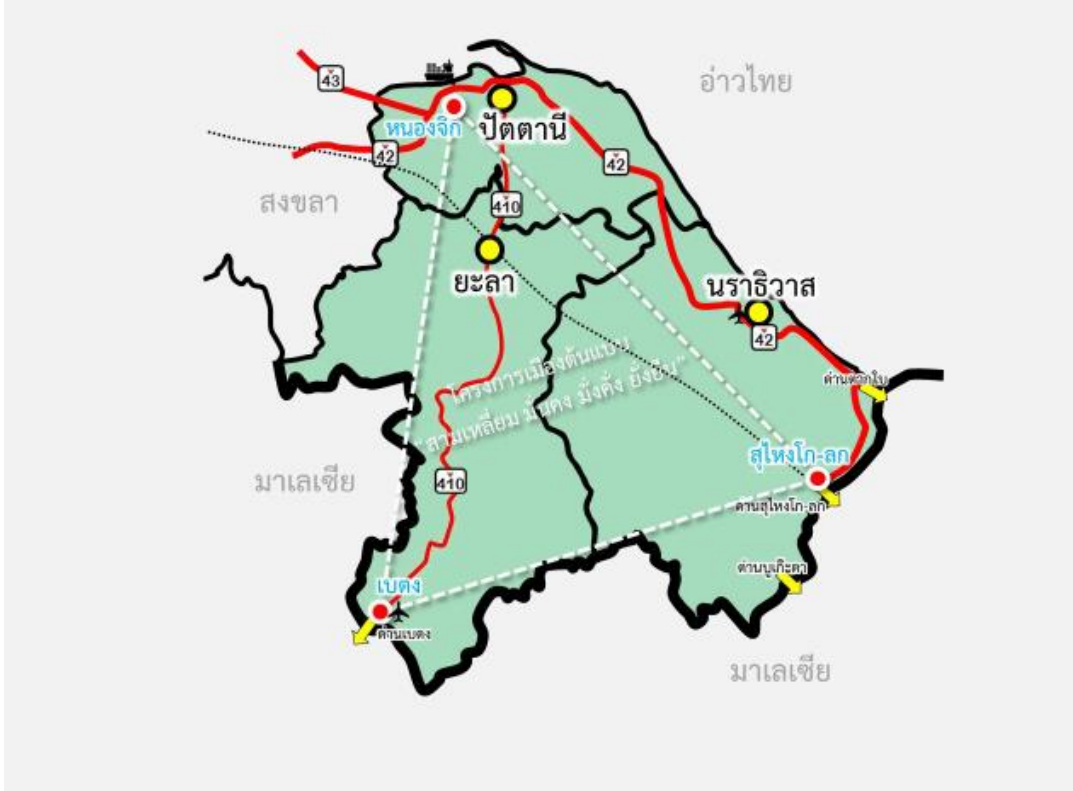
ภาพที่ ๒.๒ แผนพัฒนาภาคใต้ชายแดน

ที่มา : แผนพัฒนาภาคใต้ชายแดน พ.ศ. ๒๕๖๐ – ๒๕๖๕ ฉบับทบทวน