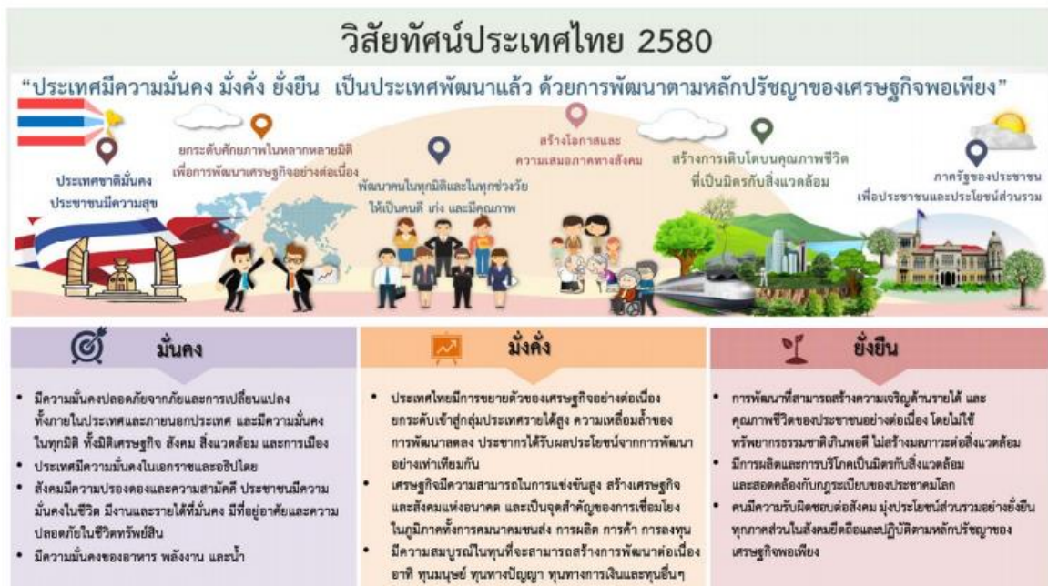
ภาพที่ ๒.๑ วิสัยทัศน์ประเทศไทย ๒๕๘๐

“ประเทศไทยมีความมั่นคง มั่งคั่ง ยั่งยืน เป็นประเทศพัฒนาแล้ว ด้วยการพัฒนาตามหลักปรัชญาของเศรษฐกิจพอเพียง”